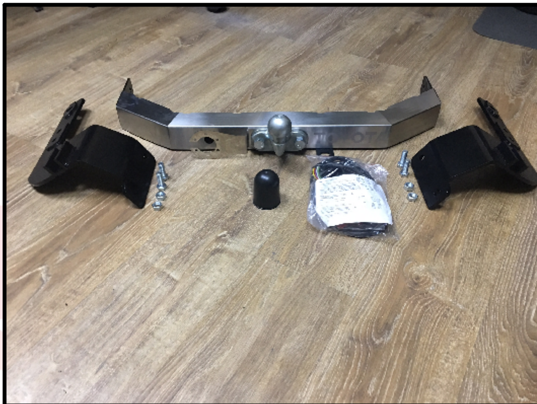
арт. TCU00050 TCU00259 (не оцинкованный)